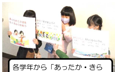
各学年から「あったか・きらきら紹介」があった、きらきら集会の一コマ

さて、先日協働型重点目標の「あったか言葉」「きらきら行動」に関連して「きらきら集会」が行われました。来年度のリーダーとなる4・5年生が中心となって、学校の中の「あったか言葉」「きらきら行動」を紹介し、今後の目標を確認する行事です。