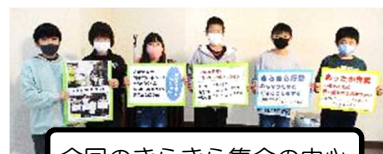
今回のきらきら集会の中心となったのは4～5年生

通常授業日における個別の授業参観（行事としての授業参観日以外にお子様の様子を参観すること）は、随時受け付けております。密を避けて参観できますので、学校でのお子様の様子をご覧になりたい方はご連絡ください。